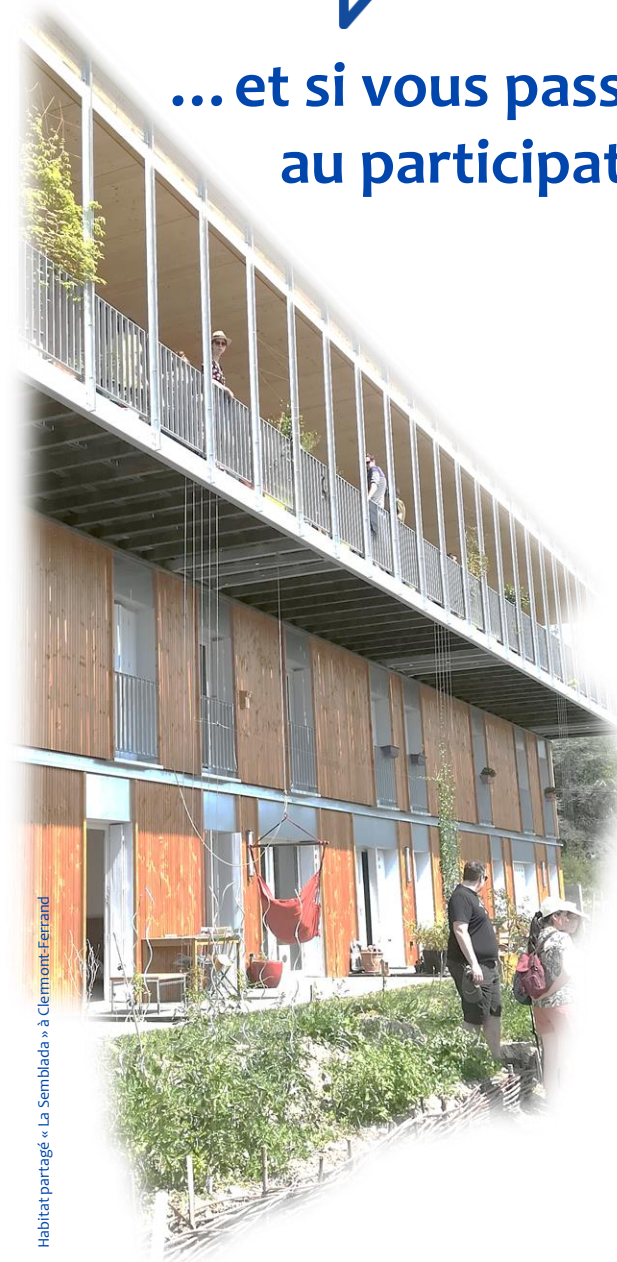
Habitat partagé « La Semblada » à Clermont-Ferrand

... et si vous passiez au participatif ?