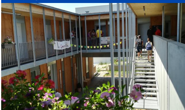
Habitat partagé « La Semblada » à Clermont-Ferrand

L'EPA Saint-Étienne, qui dispose de terrains pouvant potentiellement accueillir des projets participatifs, s'est doté de moyens pour accompagner des groupes qui souhaiteraient porter un projet à Saint-Étienne.