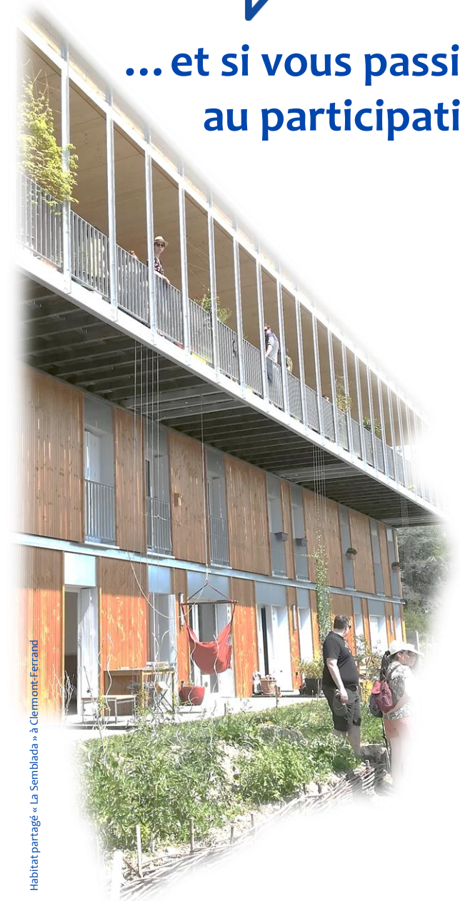
Habitat partagé « La Semblada » à Clermont-Ferrand

... et si vous passiez au participatif ?