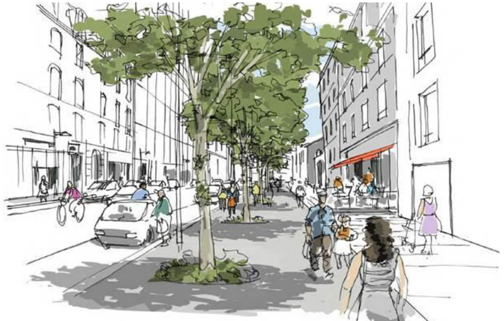
Avenue Denfert-Rochereau - vue depuis la gare en direction du centre-ville - image non contractuelle

Si vous désirez recevoir les lettres informations travaux par courriel, n'hésitez pas à vous inscrire sur : chateauxcreux@epase.fr .