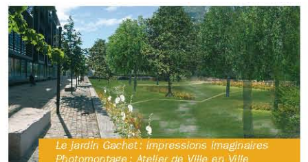
Le Jardin Gachet: impressions imaginaires - Photomontage: Atelier de Ville en Ville

Situé à proximité de la place Jacquard, il sera l'espace végétal complémentaire au caractère plutôt minéral de la place Jacquard. À terme, de nouveaux logements donneront sur ce jardin.