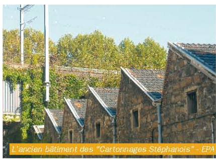
L'ancien bâtiment des "Cartonnages Stéphanois" - EPA

Il pourra également accueillir des installations artistiques, des aménagements éphémères et des événements.