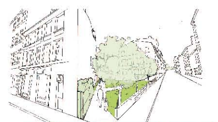
Un jardin de poche à Jacquard - JM Savignat

Afin de créer une continuité piétonne entre la rue Boisson et le passage Bonnavie, une allée piétonne, agrémentée d'un square, sera créée au centre de l'îlot entre les rues du Grand Gonnet et de Balzac. Un petit immeuble de logements viendra recomposer une façade animée sur cet espace public de 650 m 2 . Le jardin existant rue Boisson sera pris en compte dans le projet.