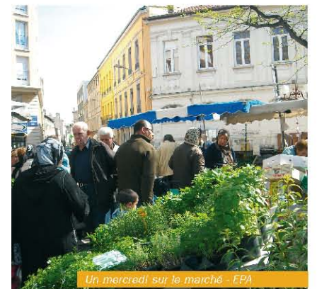
Un mercredi sur le marché