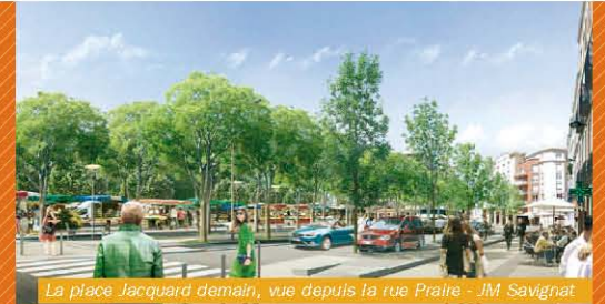
La place Jacquard demain, vue depuis la rue Praire - JM Savignat

Aujourd'hui place de marché et parking, la place Jacquard doit (re)devenir un espace à vivre. Cœur des usages du quartier, elle sera le symbole de sa rénovation. Les études et les échanges nous amènent à vous proposer de: