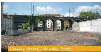
L'espace destiné à être réaménagé

Des exemples pour mieux nous comprendre... 1 - Jeux d'enfants en bois, Lyon Part-dieu, Steinfeld Designer