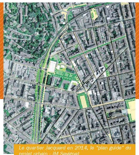
Le quartier Jacquard en 2014, le "plan guide" du projet urbain - JM Savignat

Pour renforcer la présence d'espaces verts et en faire profiter le plus grand nombre d'habitants, d'autres espaces publics sont en projet dans le quartier avec, comme "cœur vert" du quartier et pendant de la place Jacquard, le jardin Gachet.